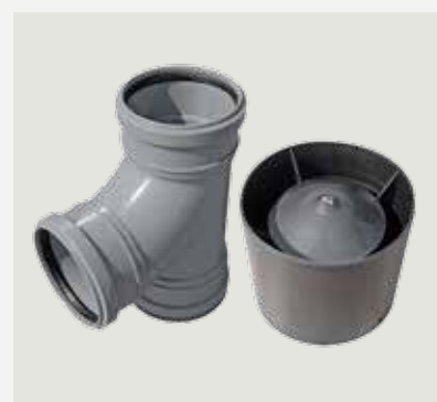
T-rör och regnhatt