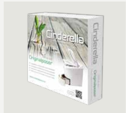
500 st papperspåsar