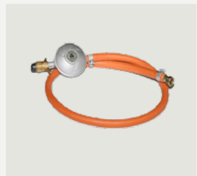
Gaslang och regulator