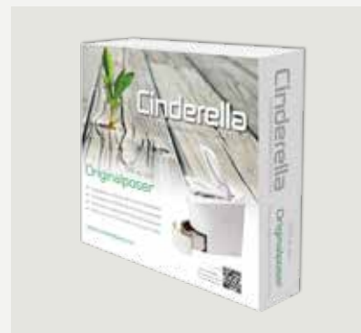
500 st papperspåsar