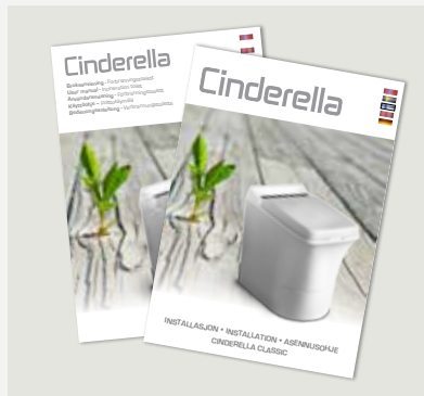
Installations- och användaranvisning