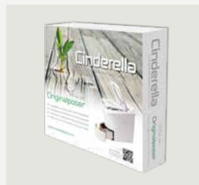
500 st papperspåsar