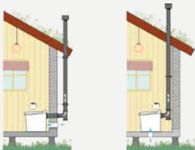
Installation av Cinderella Classic och Gas