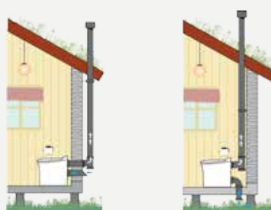
Installation av Cinderella Comfort