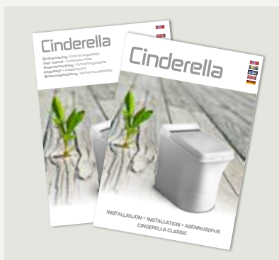
Installations- och användaranvisning