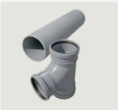
Anslutningsrör frånluft, 45 cm och T-rör