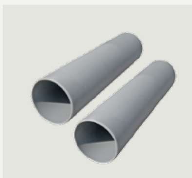
Anslutningsrör till- och frånluft, 45 cm