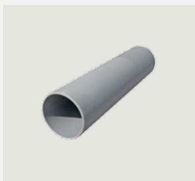
Anslutningsrör frånluft, 45 cm